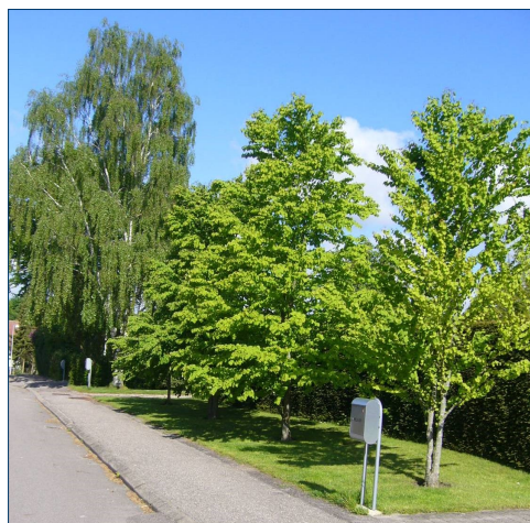
Birk og hjertetræer hos Bodil i Tølløse

Som de fleste begyndere i havekunsten plantede jeg ofte for tæt. Forinden man planter, læser man måske om hvor stort og omfangsrigt det enkelte træ kan blive, men noget andet er at respektere