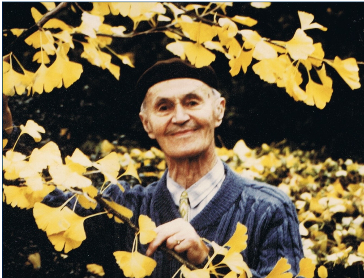
Melkær i haven i Tølløse - ved Gingko-træet