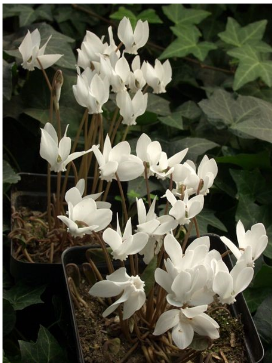
Cyclamen - Neapolitanum Alba

Den lille coum med de fine tegninger i løvet kommer med sine