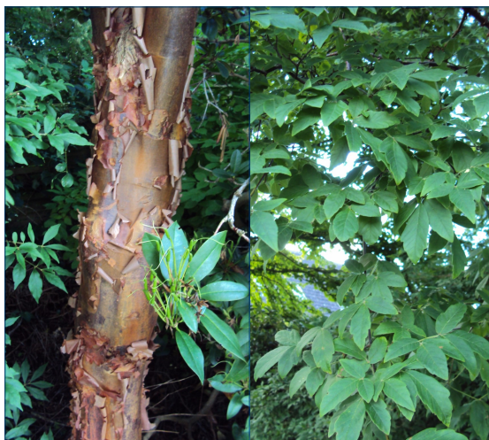
Acer griseum - bark og løv hos - Ellen