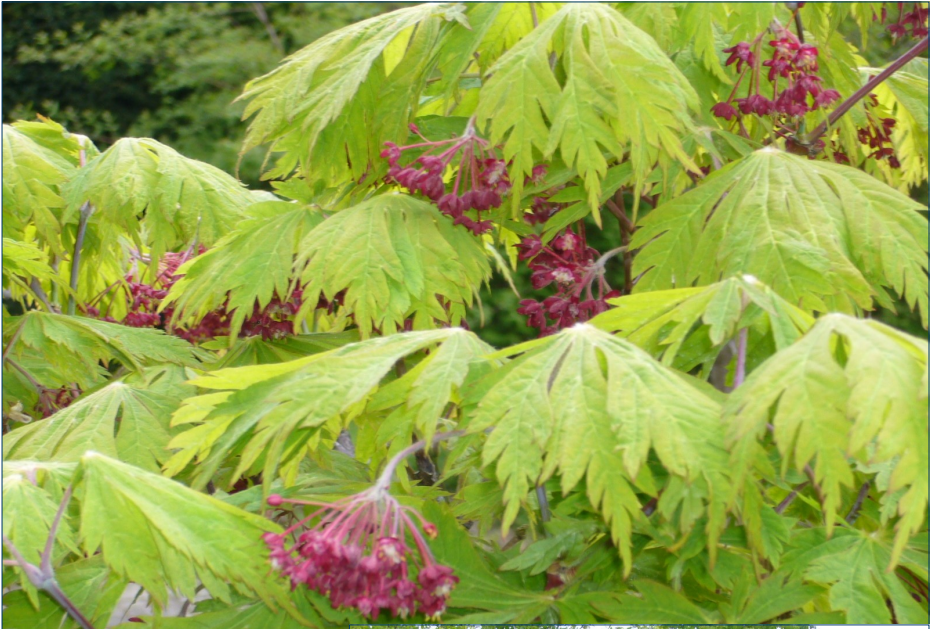
Ahorn i Bodils have i Tølløse