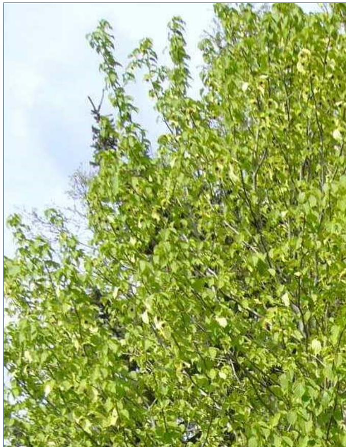
Duetræ med frø- stande og duetræ- frugt hos Bodil