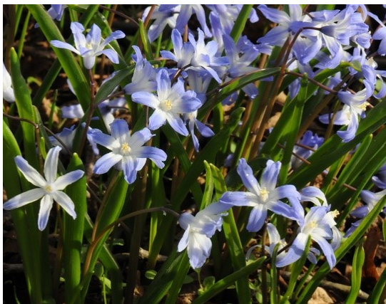
Snepryd ( Chionodoxa)

I et hjørne af haven un- der en småbladet ilex har jeg et lille fredet yndlingsbunddække af fem forskellige cycla- menarter, hvoraf neapo- litanum alba er den fro- digste. Den ældste plan- te har en knold som en stor håndflade og bærer hver eftersommer hund- redvis af blomster, og omkring sig spreder den hele flokke af børn.